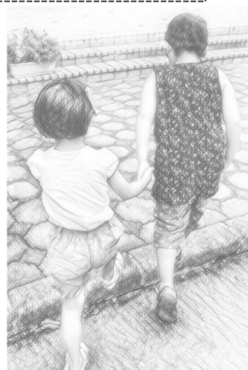
●子どもの貧困率とひとり親世帯の貧困率（相対的貧困率）