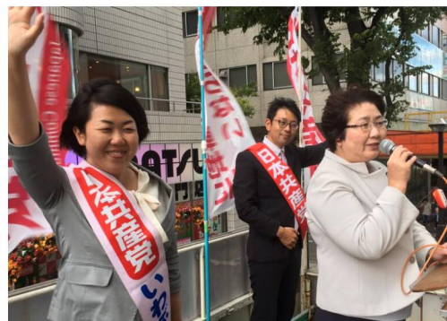
1日、福島駅前国会報告と必勝の訴え。

国会閉会の1日夕、福島市で街頭演説。その後県比例事務所開きへ。2日は青森県社会保険労務士会、青森県庁で青木副知事と懇談。3日は山形県鶴岡市、4日は宮城県で演説会。参院選必勝を訴え走る高橋議員。