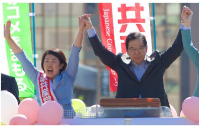
5日、札幌街頭演説で訴え。