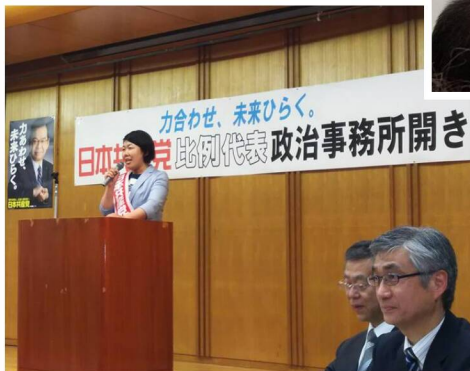
3日、岩手県比例事務所開きで訴え。