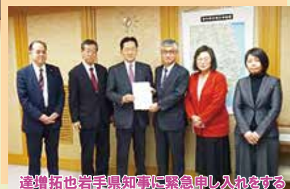
達増拓也岩手県知事に緊急申し入れをする党岩手県議団