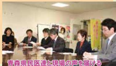
青森県民医連と現場の声を届ける党青森県議団