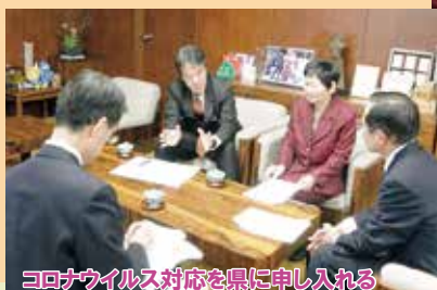
コロナウイルス対応を県に申し入れる党山形県議団